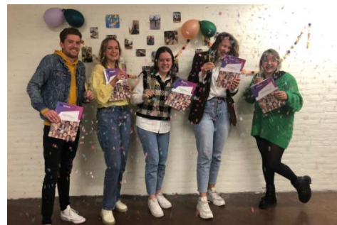
Vijf MDT Europassen zijn uitgereikt!

Het doel voor 2021 was dat NGV 100 jongeren zou inspireren en faciliteren om zich als vrijwilliger in te zetten in Eindhoven. Een prima resultaat, zeker gezien de omstandigheden. NGV is opnieuw opgestart met compleet nieuwe medewerkers in coronatijd. We zijn blij dat veel organisaties in Eindhoven NGV als samenwerkingspartner weten te vinden.