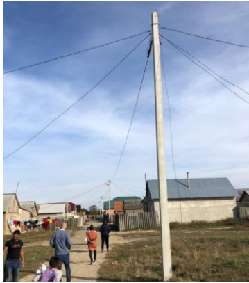
Elektriciteit is afgerond