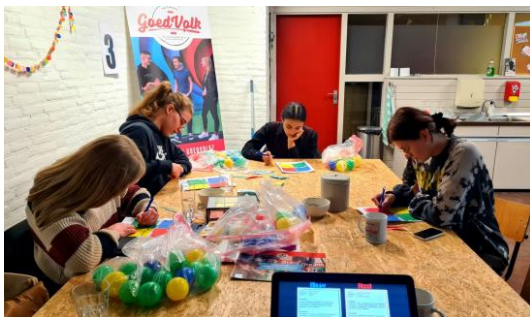
Hard aan het werk in een groeiplaats

NGV heeft een bijzonder goed jaar achter de rug. In 2021 zijn 76 unieke projecten gestart. Een project is een hulpvraag die we hebben opgelost. Dit kan eenmalig of voor langere tijd zijn. Van deze projecten waren er 41 structureel (denk aan maatjestrject). De andere projecten hadden een meer afgebakend tijdspad. De projecten zijn door 100 vrijwilligers uitgevoerd. In totaliteit zijn er 1734 vrijwilligersuren gemaakt. Naar schatting hebben zij zo'n 238 hulpontvangers geholpen. NGV organiseerde 98 activiteiten. Hieronder rekenen we groeiplaatsen en andere activiteiten voor vrijwilligers.