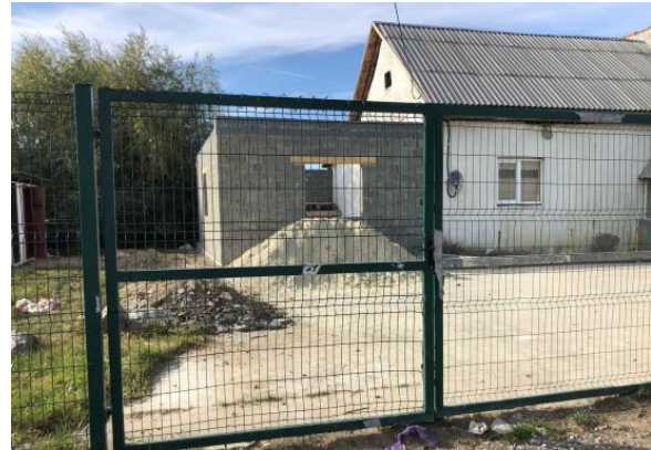
Renovatie van de school