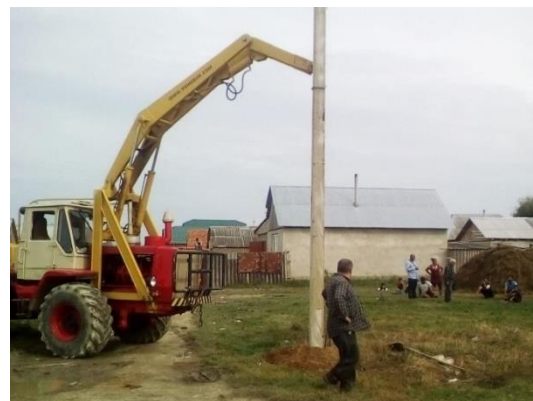
De eerste elektriciteitsmast in de grond