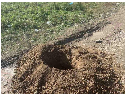
Het gat voor de eerste elektriciteitspaal!

COVID-19 zette een dikke streep door de geplande jongerenreizen. De risico's waren te groot. In plaats daarvan hebben vol ingezet op projecten in het Roma-kamp zelf. De stichting heeft fondsen geworven en giftgevers hebben hun betrokkenheid getoond. Daardoor kon in het Roma-kamp legale elektriciteit worden aangelegd. Geen illegale stroom aftap, met dodelijke ongelukken als gevolg van losliggende kabels. De eerste huizen hebben inmiddels stroom gekregen.