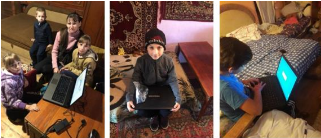
De gezinnen waren heel blij met de laptops

De regering van Oekraïne had in het begin van het jaar alle scholen en kleuterscholen gesloten. Pas begin september was het pas mogelijk om ze weer te openen. De kinderen konden op school een normaal schooljaar niet afmaken. De 2e coronagolf zorgde voor een hernieuwde sluiting van de school. Geen school betekent voor de kinderen geen goede maaltijd en voor de leerkrachten geen salarisinkomsten. Dat heeft grote impact. We hebben geld voor voedselpakketten en laptops voor een aantal kinderen kunnen werven. Daarnaast een stukje financiële ondersteuning voor de leerkrachten waar wij contact mee hebben.